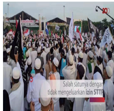
极端势力FPI聚众示威

19日全国确诊病例上涨到7753人，雅城有1893人，正是极端势力示威造成的一项后果。（小全）