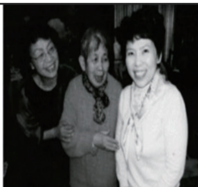
2008年北京奥运会后, 欧美同学会召开庆祝会, 著名乒乓球运动员邓亚萍主持为方琳颁发奖状后合影