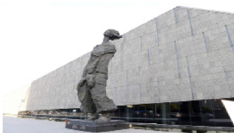
△侵华日军南京大屠杀遇难同胞纪念馆

2020年12月13日是南京大屠杀惨案发生83周年，也是第7个南京大屠杀死难者国家公祭日。南京大屠杀幸存者忆往昔，血与泪的历史仍历历在目；看今朝，希望天下和平、没有战争。回忆，是为了更好地前行。铭记历史，珍爱和平！（策划：光明网 张倩 制作：光明网 耿楠楠）