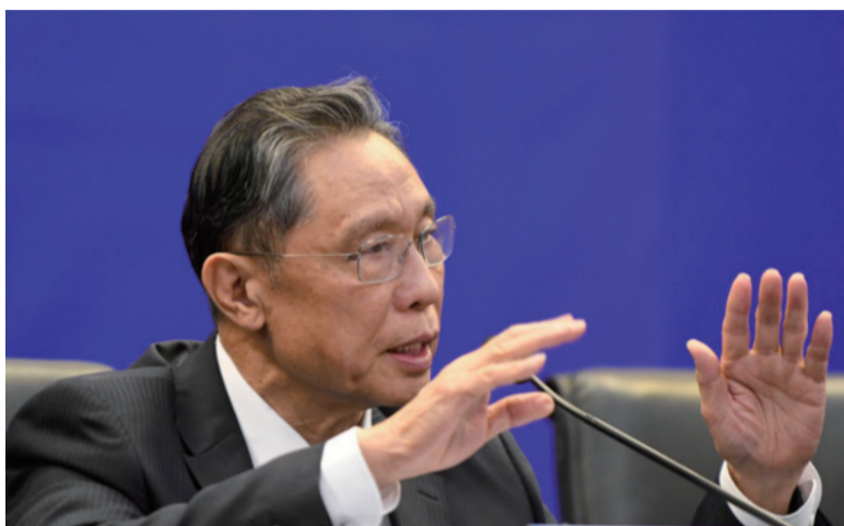
钟南山出席广州市疫情防控新闻通气会（3月18日摄）。