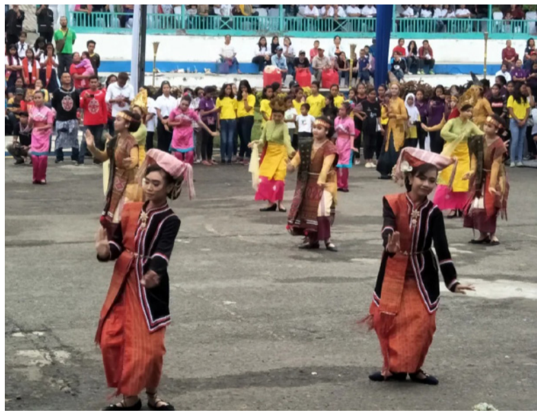
能歌善舞的当地人民