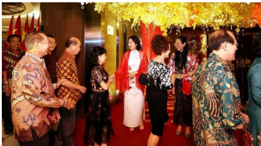
各界人士身着巴迪出席总领馆国庆活动