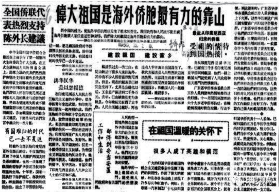
伟大祖国是海外侨胞最有力的靠山。 (1959年12月12日《青年报》)