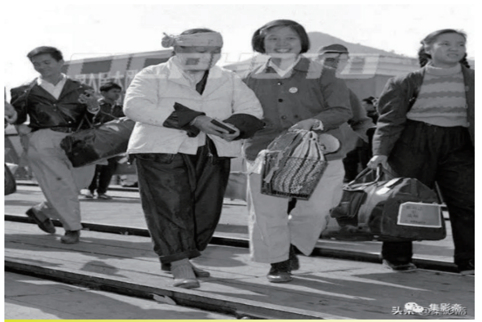
热情的接待和慰问，感动着归侨 1960年1月11日