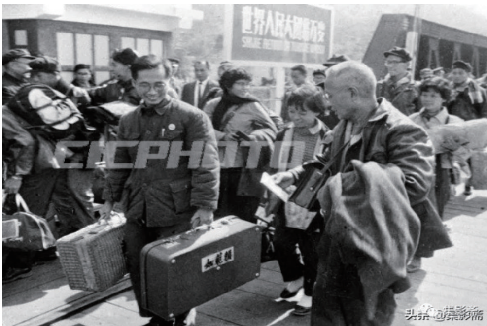
热情的接待和慰问，感动着归侨 1960年1月11日