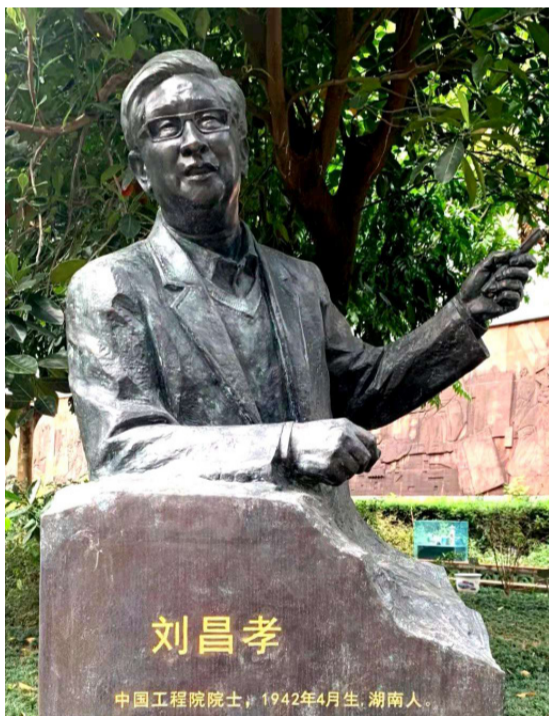
广州《神农草堂》药用植物园的铜像