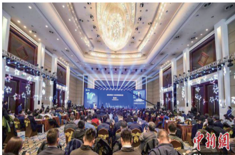
27日下午，“2020能源转型论坛暨第十屆全球新能源企业500强峰会”在山西太原举行。