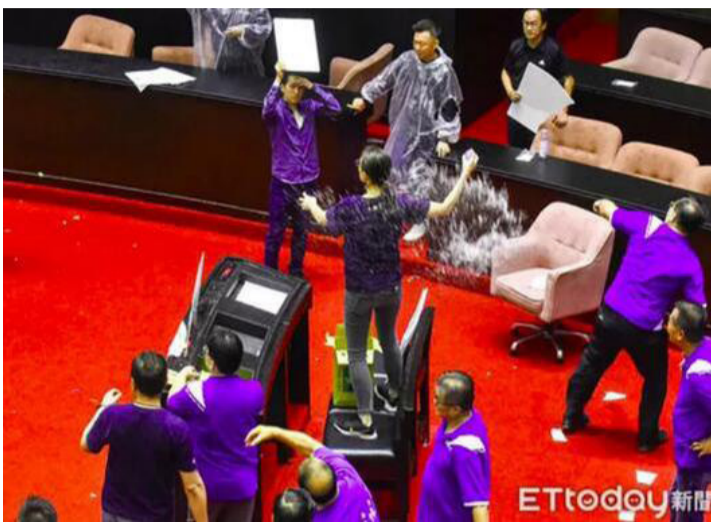
蓝绿7月18日打水仗。

据“自由时报”报道，苏贞昌在穿着雨衣的民进党“立委”的团团围住下上台报告，国民党团持续抗议，民进党“立委”吴秉叡与国民党“立委”郑正铃、郑天财及基进“立