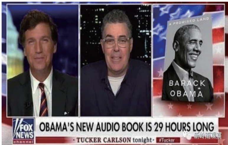
OBAMA'S NEW AUDIO BOOK IS 29 HOURS LONG - TUCKER CARLSON tonight - #Tucker