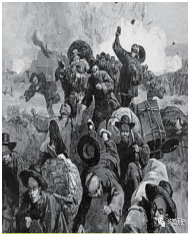
美刊插画：1880年代遭驱赶杀戮的华人

在“自由”与“安全”之间，每次为了“国家安全”牺牲“个人自由”的时候，牺牲最多的常常