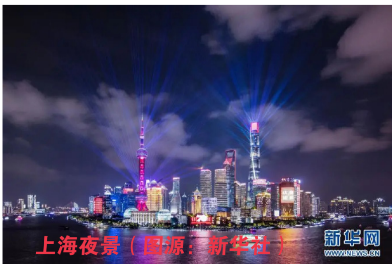
上海夜景