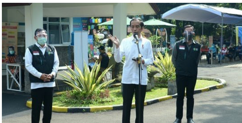
佐科维总统巡视茂物准备注射疫苗诊所，他表示愿意成为首位注射疫苗者。

由于极端派伊斯兰保卫阵线头目里杰克于11月10日从阿拉伯返回印尼与11月14日在其住家举行女儿结婚典礼，