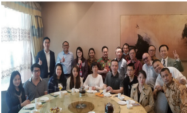
出席座谈会领馆办事员及全体人员