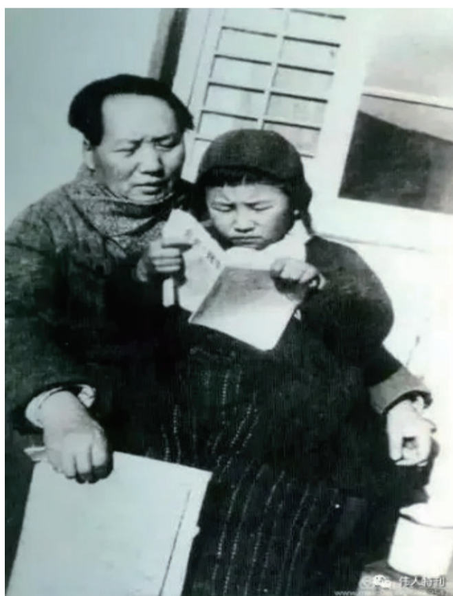
1946年，毛泽东在延安窑洞前教李讷识字。毛泽东是否每日也和如今的父亲一样教孩子呢？