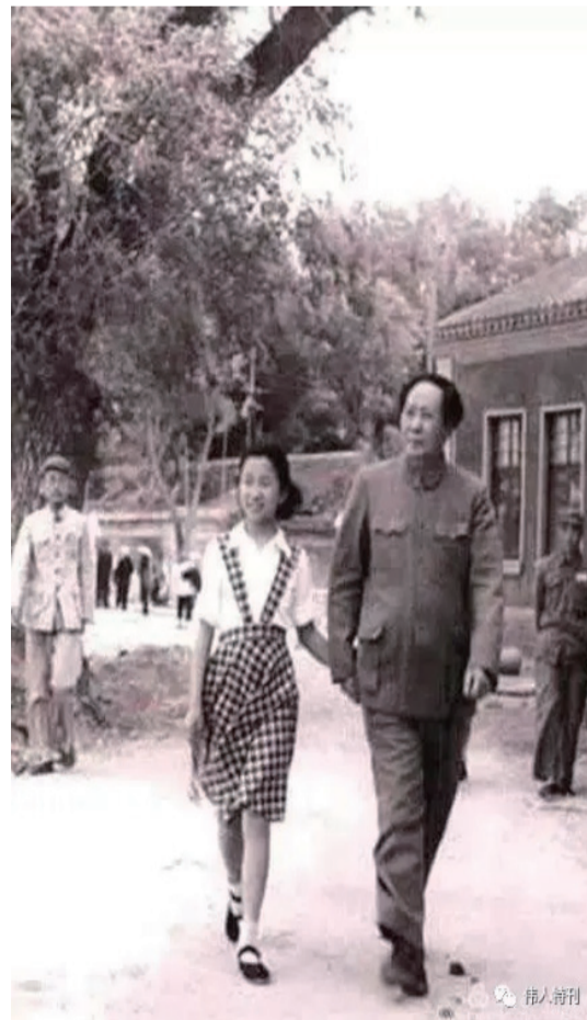
1951年6月，毛泽东带李讷在中南海散步。