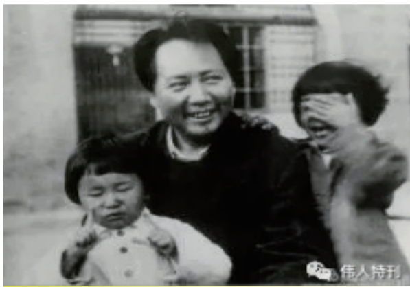
1943年，毛泽东和女儿李讷，右边为叶子龙的女儿叶燕燕。三人形态各异，有趣乎？