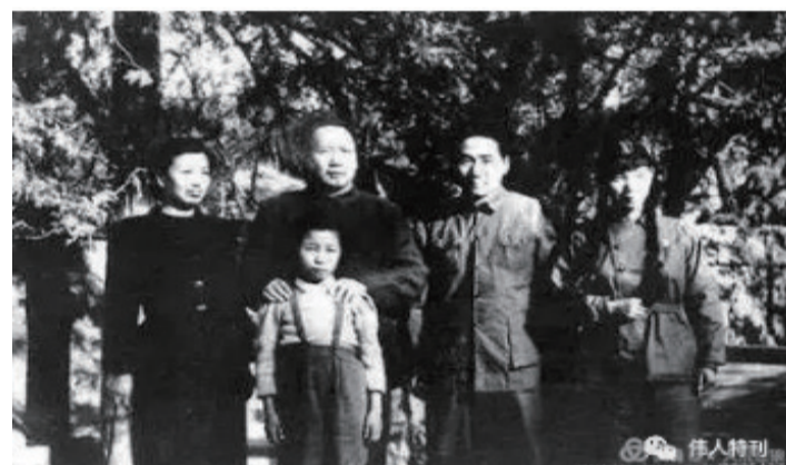
1949年，毛泽东与江青和毛岸英、儿媳刘思齐、李讷在香山。全家福哦！