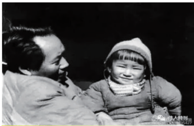
图为1943年冬，毛泽东与小女儿李讷在延安枣园。这张温馨的照片，父女情深，至今令人感动。