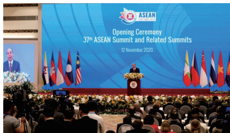
亚细安轮值主席国越南主持的第37届亚细安峰会11月12日正式开幕，越南总理阮春福在开幕礼上发表讲话。

宣言指出，在亚细安公共卫生突发事件协调委员会工作组的支持下，亚细安协调委员会将负责协调和监督《亚细安旅行走廊安排框架》的制定进程，在兼顾各成员国之间的现有双边安排的同时，确保《亚细安旅行走廊安排框架》成功付诸实行。