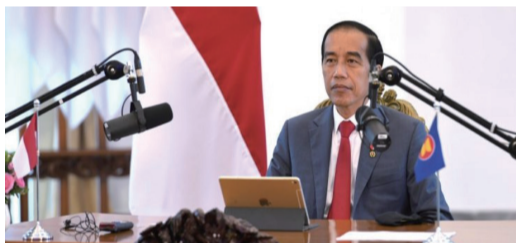
11月12日，佐科维总统在西爪哇省茂物总统府出席以线上视频方式举行的第37届东盟峰会。

致辞中强调东盟各成员国要加强合作，维护东盟国家的团结精神，不介入大国之间的博弈，以确保亚洲和区域和平安全。