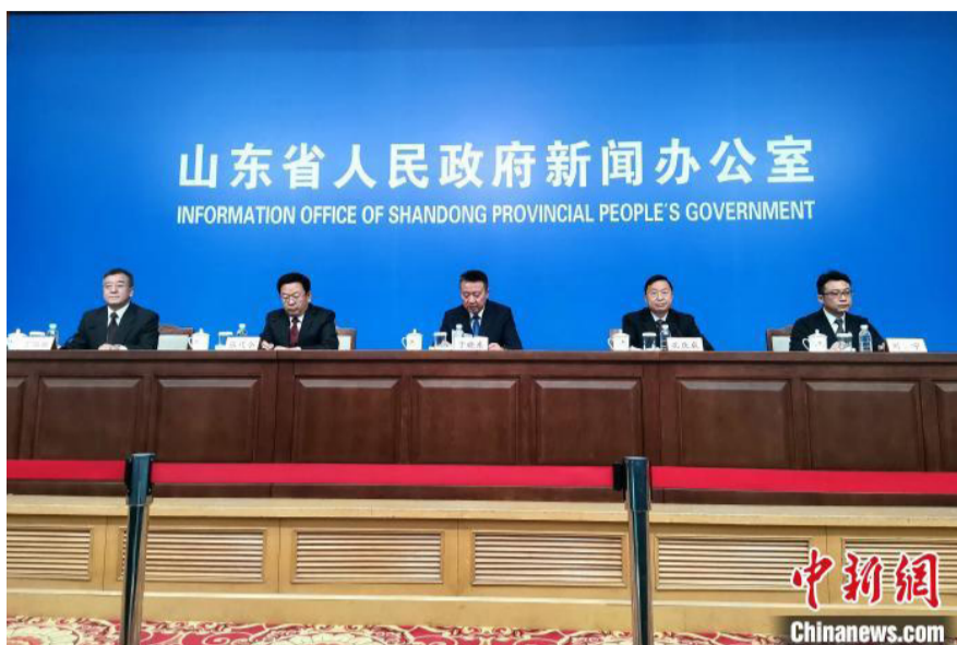
11月11日,山东省人民政府召开新闻发布会介绍2020年世界工业设计大会情况。

“面对充满挑战和机遇的新格局,中国制造业最大核心的问题仍是缺乏自主创新能力,产品同质