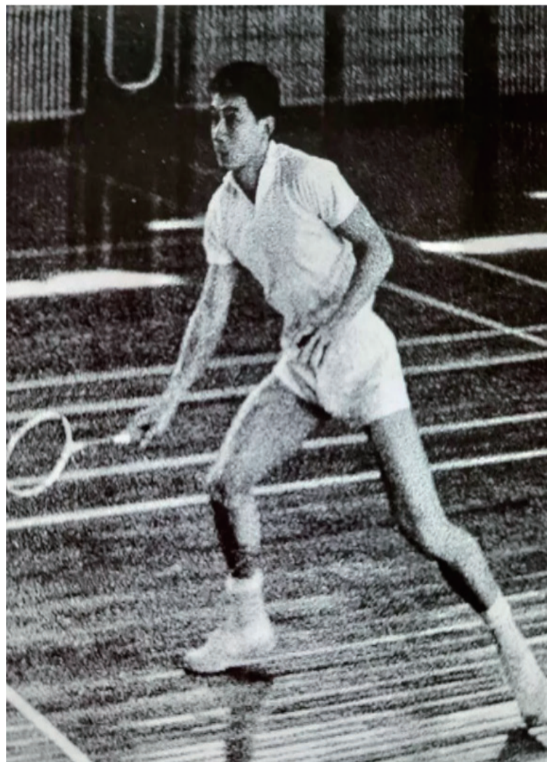
年轻时代的汤仙虎，是世界级羽坛名将。