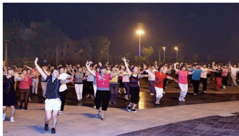
中国大妈在跳广场舞