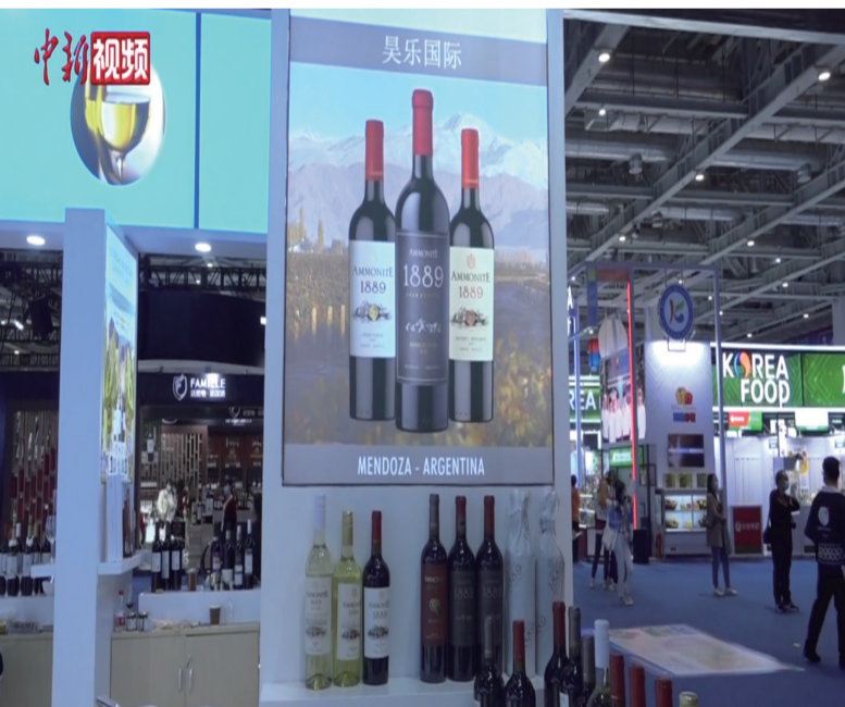
第三届中国国际进口博览会

在第三届中国国际进口博览会(以下简称“进博会”)上,世界500强和行业龙头企业踊跃参与,以期在全球疫情大背景下借助展会寻找更多合作伙伴,增强与中国之间的进出口合作。