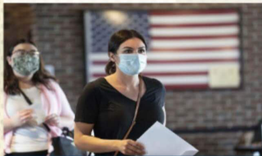
10 月 28 日，在美国华盛顿的一处投票站，选民排队参加投票。