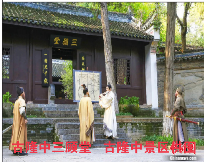
古隆中三顾堂