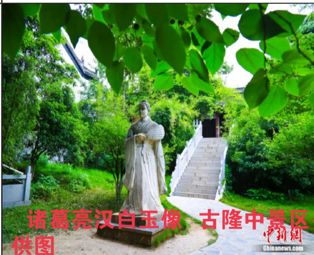
诸葛亮汉白玉像