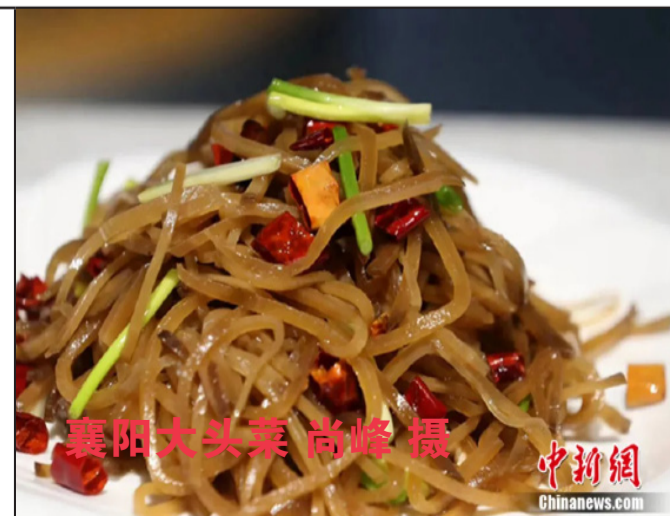
襄阳大头菜