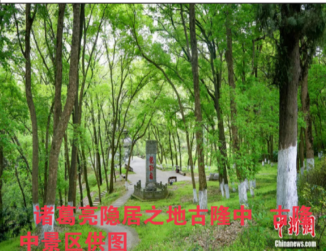
诸葛亮隐居之地古隆中