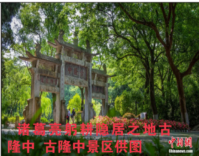
诸葛亮躬耕隐居之地古隆中