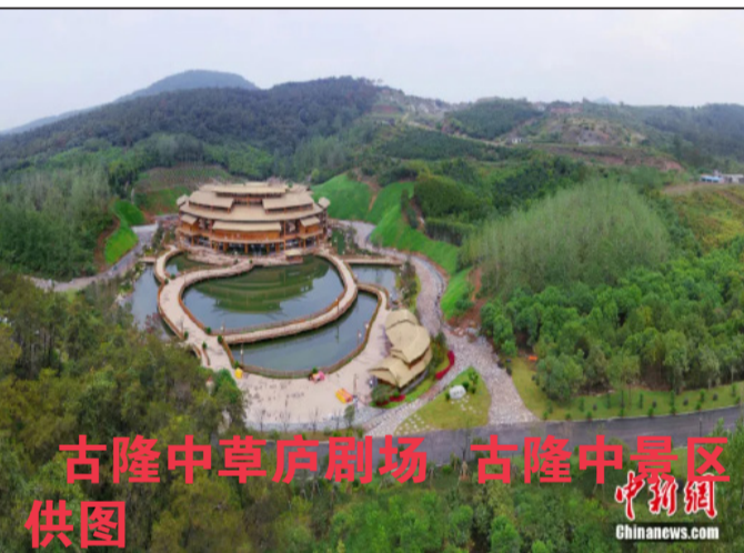
古隆中草庐剧场