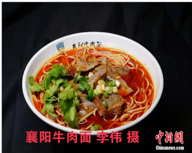
襄阳牛肉面