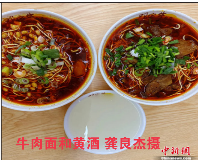
牛肉面和黄酒