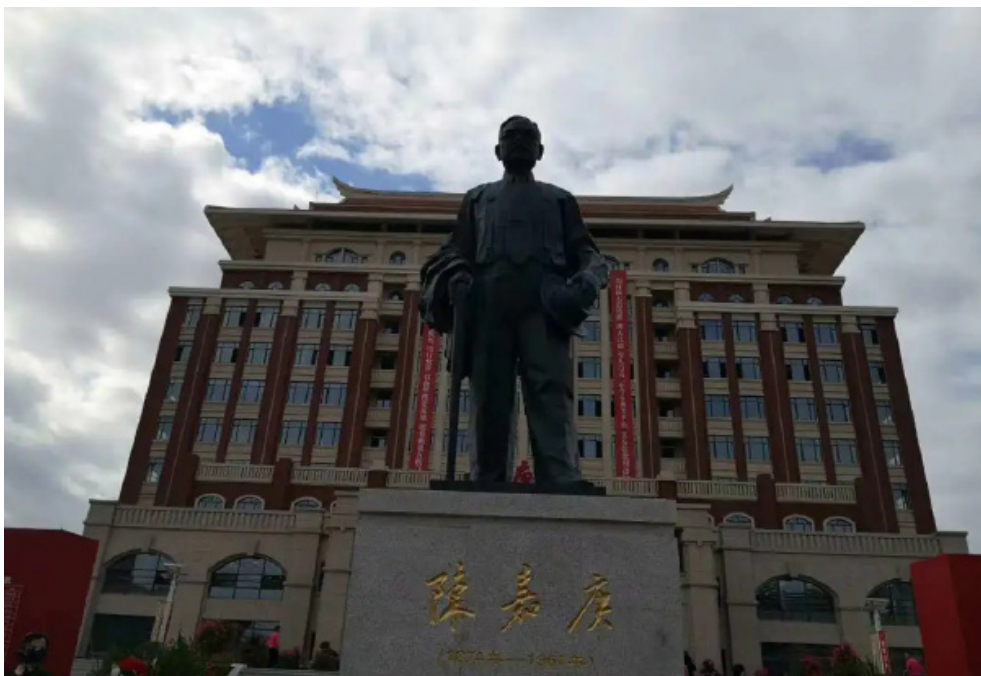
集美工业学校陈嘉庚铜像落成

今年是陈嘉庚创办职业教育100周年。1920年，陈嘉庚先生本着“教育立国”和“实业强国”的理念，在其倾资创办的集美学校开办水产科和商科。期间，历经战乱、播迁、复员、新生，数度分合、迭经裁并，逐渐发展出厦门海洋职业技术学院、集美工业学校等专业丰富、特色鲜明的职业院校。现如今，两校秉承嘉庚遗志，在各项大赛中屡创佳绩、备受嘉奖，先后获评为全国教育系统先进集体、教育部国防教育特色学校、福建省示范性现代职业院校等，享有“中职航母”、福建海洋产业“黄埔军校”等美誉。