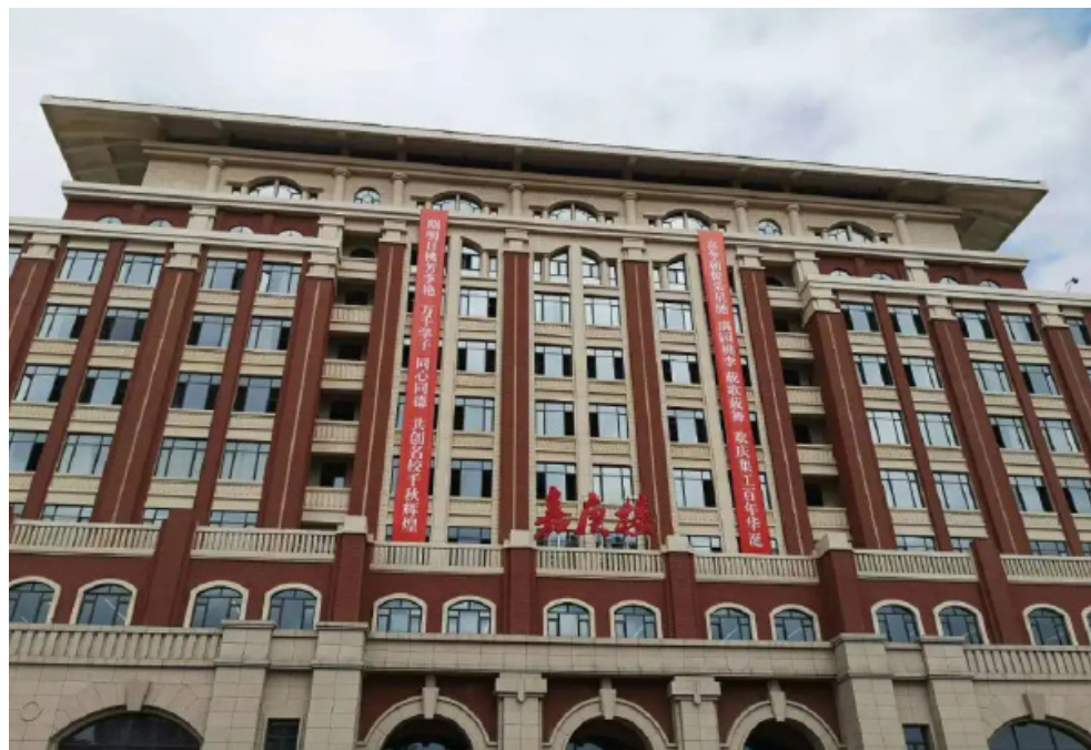
集美工业学校百年校庆纪念活动现场