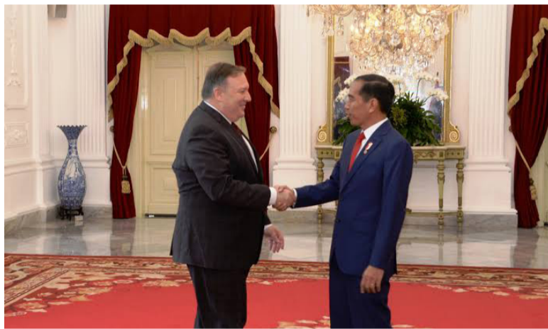
美国国务卿蓬佩奥于29日到访雅加达

（本报特约）以煽风点火著名的美国国务卿蓬佩奥于29日到访雅加达二天，会见佐科维总统、雷特诺外长和向伊联青年阵线”安梭”领导发表讲话，其主要目的集中在三点：1) 公开挑拨离间印尼与中国的战略伙伴关系，攻击中印尼“一带一路”建设发展；2) 阴谋破坏南海的安全稳定，在南海以航空母舰煽风点火，拉拢印尼和东盟加入反华阴谋；3) 推销“印太战略”，企图打造围堵中国的“战火圈”，阻挡和平发展、互利共赢的经济建设蓝图。蓬