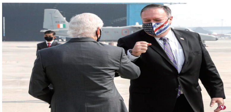
到印度访问的美国国务卿蓬佩奥（右）指出，美国 and 印度必须合作，共同应对中国构成的威胁。（法新社）