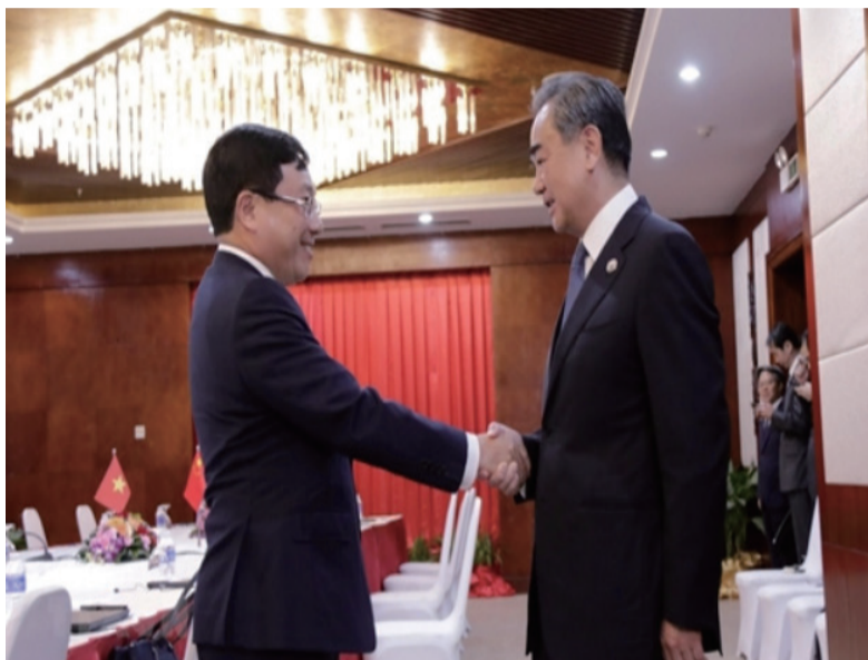
越南政府副总理兼外长范平明会见 中国国务委员兼外交部长王毅

继8月出访欧洲5国、9月访问俄罗斯和中亚之后，王毅外长线下外交“复工复产”的第三站放在了东南亚，到访了柬、马、新、老、泰5个国家，出访前还在云南接待了印尼总统特使、菲律宾外长，7天7国，基本覆盖了整个东盟，体现了“亲诚惠容”的周边外交理念。王毅东盟之行释放了哪些信号？笔者和大家一起分享下看法。