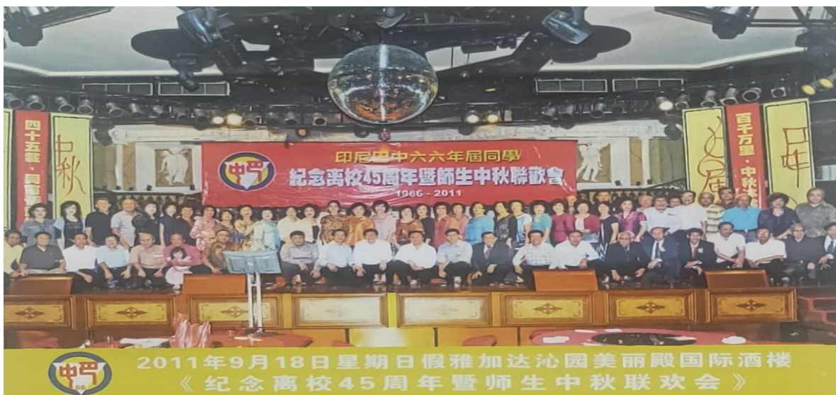
2011年9月18日星期日假雅加达沁园美丽殿国际酒楼 《纪念离校45周年暨师生中秋联欢会》