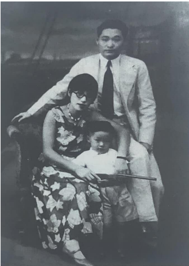
祖父、祖母和父亲合照

1997年我一帆风顺地完成本科学业参加工作,2003-2005年又远赴英国深造留学英国期间,最令我暗笑皆非的是:许多西方人对中国的认知还停留在文革期间甚至解放前;在他们眼中彬彬有礼、着装体面、受过高等教育的我们应该是日本人或韩国人;每每获知我们是中国人的时候,都会问一些关于中国的但被外国媒体误导甚至严重扭曲的话题;我们中国学生携带的电脑、手机和掌握的IT技术经常令英国房东惊叹不已。总之,21世纪的中国留学生让很多英国人感到像讶,我们也自然而然地成为了中国新时代的形象代言人、甚至很多时候成为了维护祖国声誉、反驳