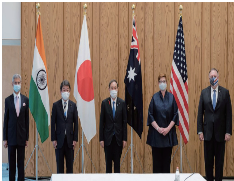
印度外长苏杰生（左起）、日本外相茂木敏充、首相菅义伟、澳洲外长佩恩、美卿蓬佩奥在会谈前合照。

问：10月6日，美日印澳四国外长会在东京举行，四方讨论了包括东海、南海等问题在内的地区局势，强调与更多国家推进“自由与开放的印太”。同日，美国国务卿蓬佩奥接受日本媒体专访，称世界长期面临中国威胁，并就东海、南海、网络安全、中印边境局势等问题对中国进行指责。请问中方对