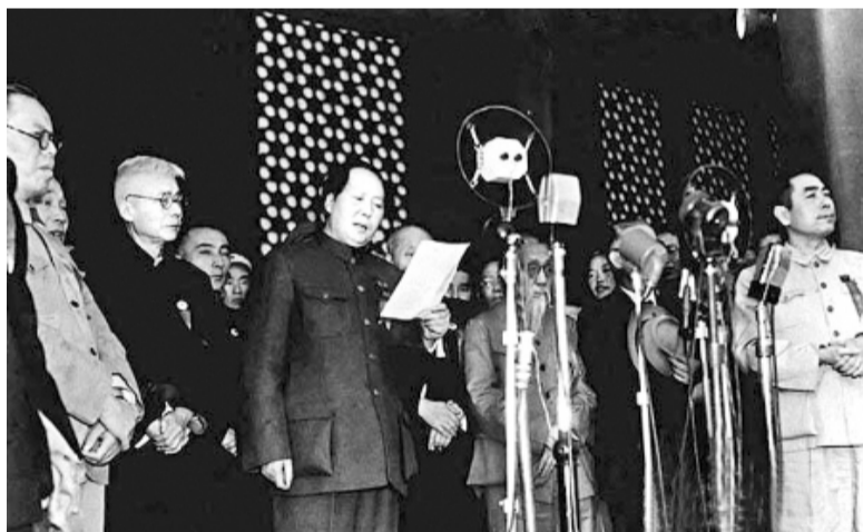
1949年10月1日，毛泽东主席在天安门城楼上庄严宣告中华人民共和国成立。

开国大典后，中华人民共和国政务院教育部部长、中国民主促进会中央主席马叙伦认为，中华人民共和国已经成立，