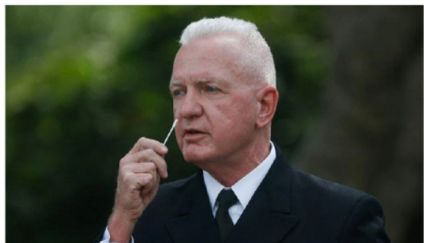
△ 《纽约时报》报道：特朗普计划向各州分发1.5亿新冠快速检测试剂

Governors of both parties welcomed the plan, but some health experts noted limitations of the kits made by Abbott Laboratories.