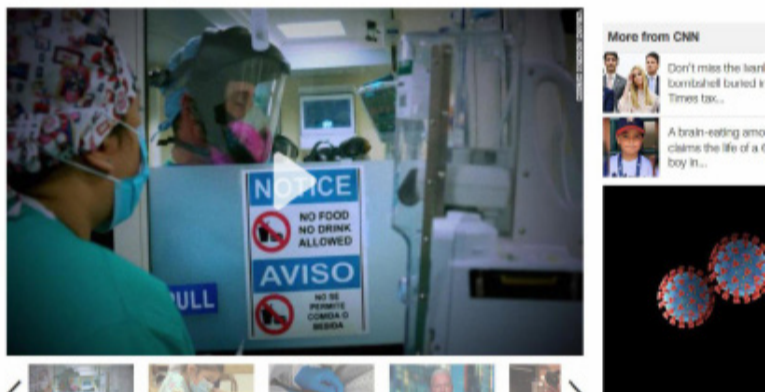
△ 美国有线电视新闻网报道：专家警告美国新冠疫情恐再次迎来暴发

Experts are warning of a coming surge of Covid-19 cases in US By Christina Maxouris and Nicole Chavez, CNN Updated 4:17 PM ET, Sat September 26, 2020