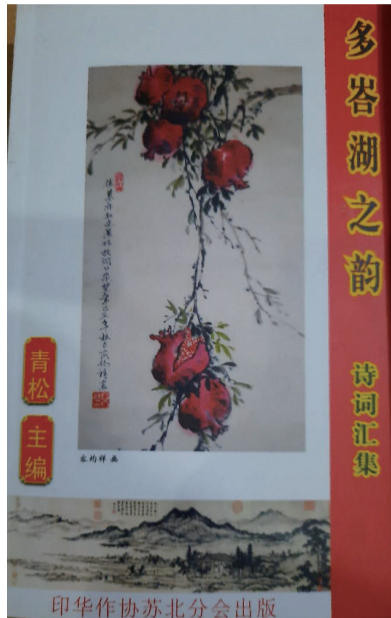
多巴湖之韵 诗词汇集