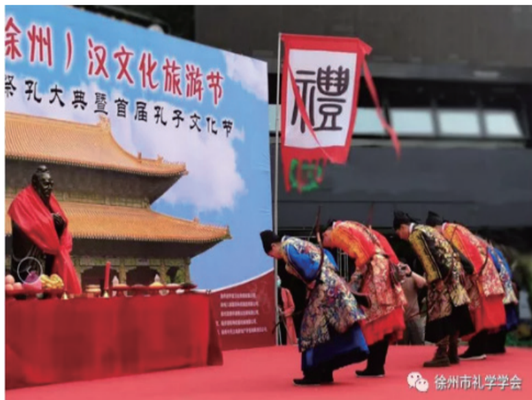
向大成至圣先师行礼