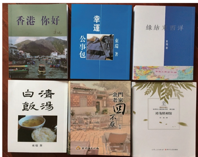
四部散文集及两部小小说集