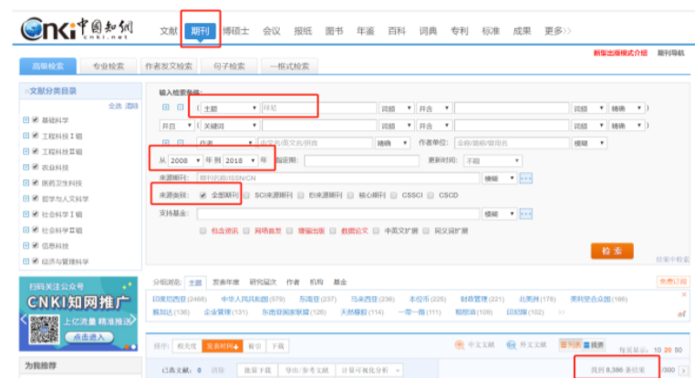
图 1：2008—2018 年中国的印尼研究文章总数

以2008—2018年为研究时段，以“印尼”为关键词，在中国知网检索全部期刊共有8386篇文章，总数大，如下图1。其中，期刊类型跨度大，从较多刊发印尼研究成果的《东南亚研究》、《亚太经济》、《华人华侨历史研究》到专业性较强的《勘察科学技术》、《水道港口》、《人造纤维》，以及一些较少刊发印尼研究成果的期刊，如近期的《柳州职业技术学院学报》、《中华女子学院学报》、《湘南学