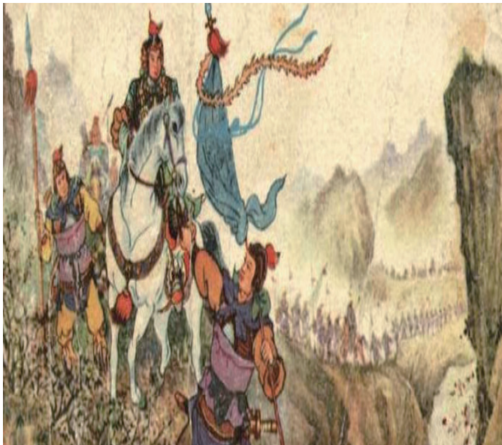
明修栈道，暗度陈仓