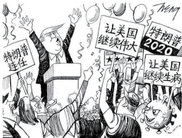
王锦松漫画 (新加坡)

但从美帝国的“道德制高点”来看，中心国还认为边缘国的人们应感激美国。可是这一美国梦幻早已结束。作者认为，“四足畸胎”正濒临死亡，因为它的触角在一个接一个的死去。