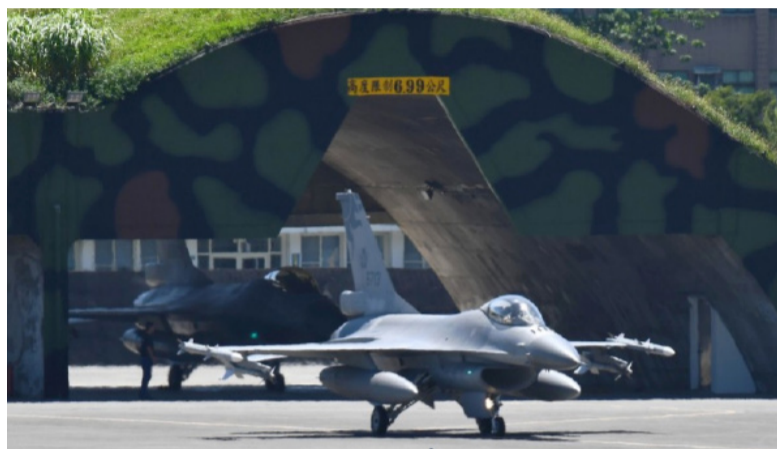
9月18日，台湾空军5联队F-16V战机从花莲基地起飞起截击解放军战机，注意其携带的AIM-120导弹