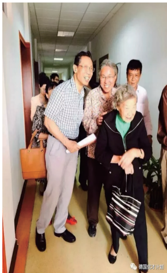
钟南山院士和舅妈陈锦彩（前）在鼓浪屿