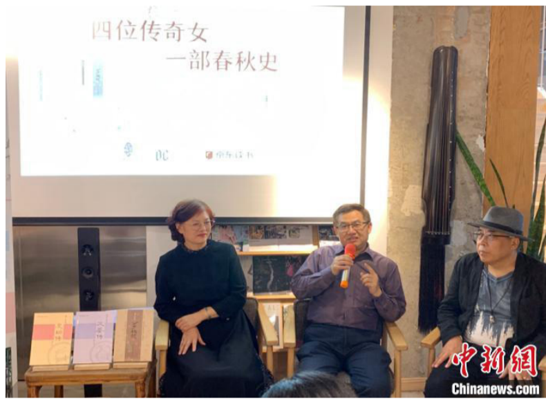
“春秋名姝”系列丛书推出《文姜传》

者把视角放在女性身上，特别是这些女性在幕后对历史的发展起了巨大作用，但是史书中对女性的着墨不多，她们更多的是出现在民间传说中，这就给创作带来很大的空间，同时也带来了难度。历史小说的创作像是带着镣铐跳舞，对创作者提出了很高的要求。作者要充分了解历史背景，从历史深处挖掘，对当时的文化、衣食住行、生活习惯了如指掌。