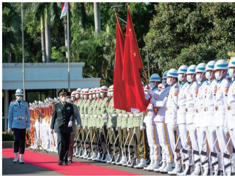
普拉博沃为魏凤和举行欢迎仪式,检阅仪仗队并到机场迎送。