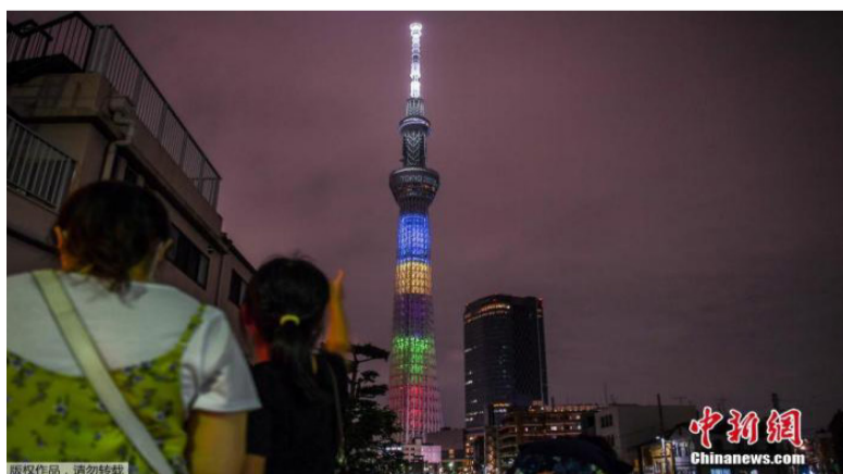
当地时间2020年7月23日，日本东京，东京奥运会倒计时一周年，东京晴空塔亮起奥运五环色灯光。

中新网9月7日电据日本共同社报道，监督东京奥运筹备状况的国际奥委会(IOC)协调委员会主席科茨7日指出，因新冠疫情影响延期至2021年的东京奥运“无论有没有病毒”都将举办，不会再度延期或者停