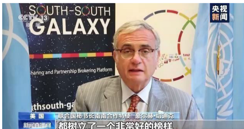
美国 联合国秘书长南南合作特使 豪尔赫·切迪克 都树立了一个非常好的榜样