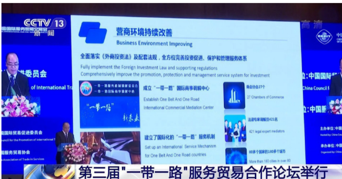
第三届“一带一路”服务贸易合作论坛举行