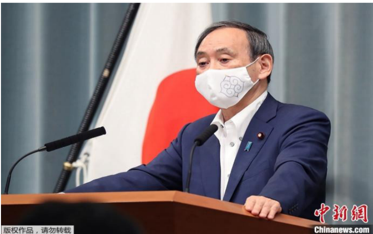
图为日本内阁官房长官菅义伟。

中新网9月2日电据日本共同社报道，当地时间9月2日，日本官房长官菅义伟召开记者会，正式宣布参加自民党总裁选举。菅义伟表示，“将向堆积如山的课题发起挑战”，如经济复