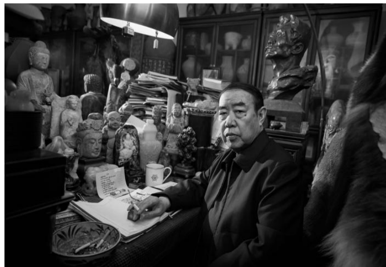
作家贾平凹。