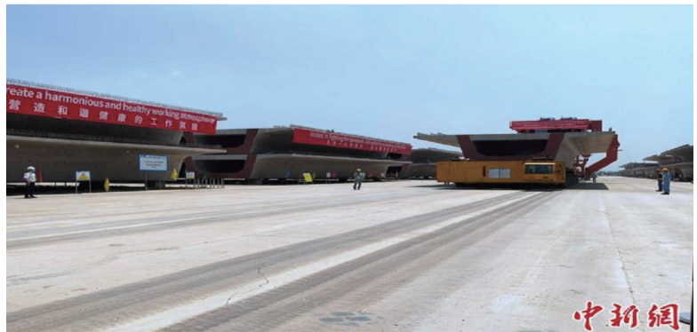
8月26日进行的运梁交通模拟。