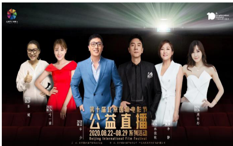
第十届北京国际电影节公益直播海报

8月22日至29日，北京国际电影节力邀华少、林依轮、叶一茜、周韦彤、李静等多位明星主播和网络达人作为活动推广大使，连续举行6