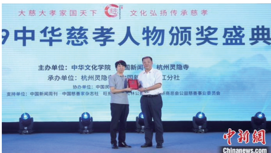
图为往年慈孝文化节颁奖典礼