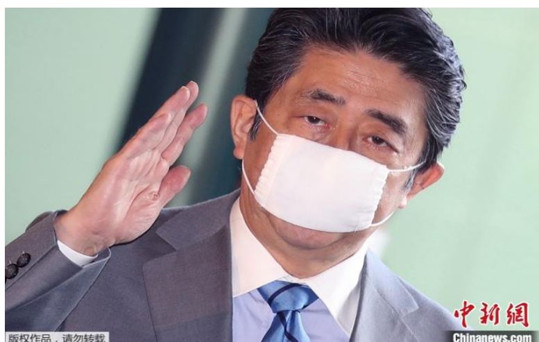
资料图为日本首相安倍晋三。

海外网8月26日电 日本首相安倍晋三近日来多次入院，其健康状况引发外界担忧，谁将成为他的继任者也成为热门话题。对此，日本内阁官房长官菅义伟26日正式回应称，“安倍的任期还有一年，现在